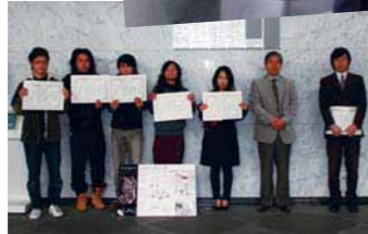
学部長表彰のネームプレート(システム工学部A横ロビーに掲示)